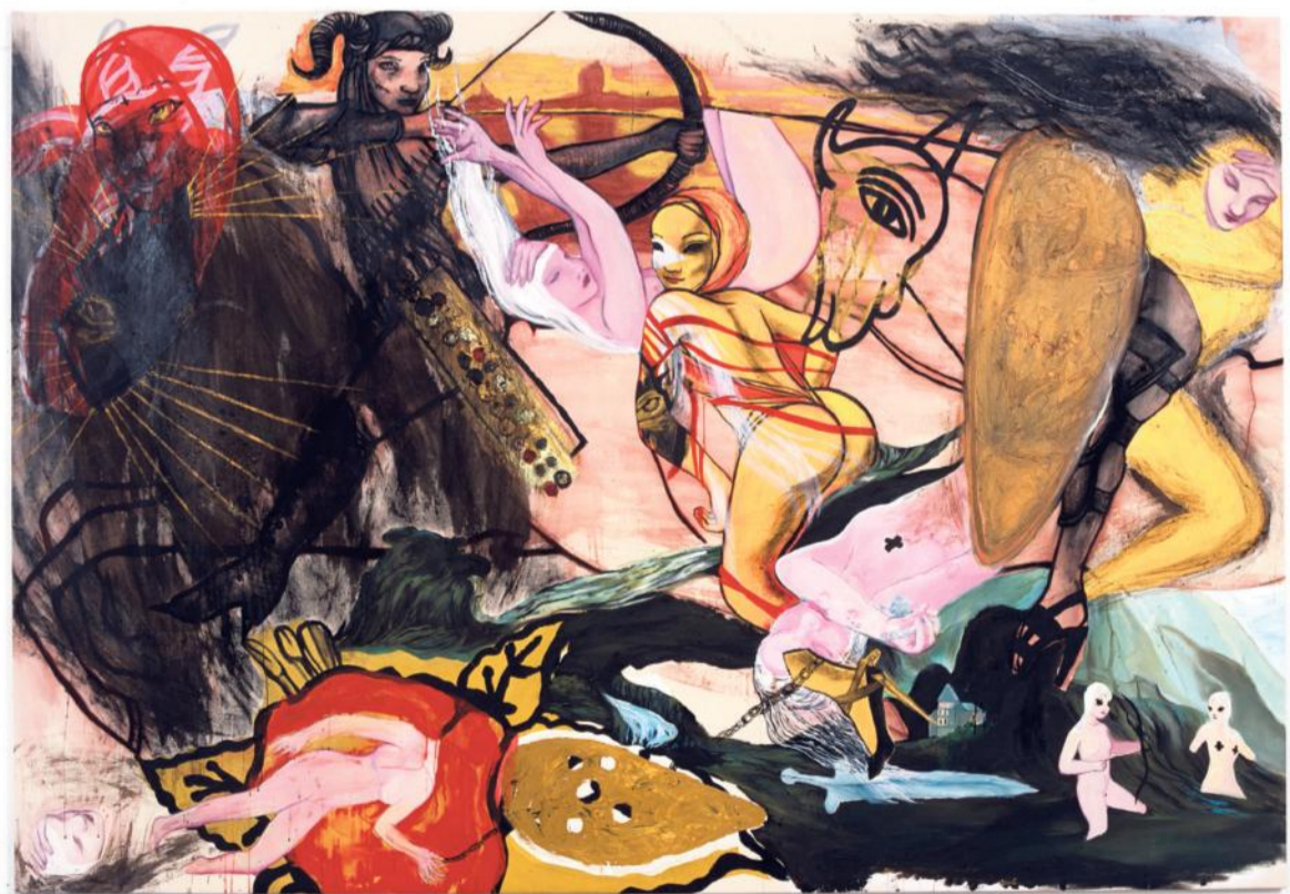
The Wild Hunt (2003) door Rita Ackermann is een van de werken uit de collectie van Chadha die worden getoond.

„Wij proberen daar tien minuten van te maken.” Idema en Folkersma organiseerden al twee keer eerder De Grote Kunstshow, met de Stadschouwburg Amsterdam. Toen mochten ze kunstwerken lenen uit de kunstcollectie van de Rabobank.