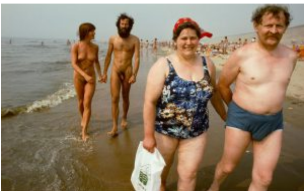
Eye Love You (1977)

De doorlopende projectie van de beelden uit Eye Love You gaat gepaard met een fraaie muziekkeuze. Het ingetogen 'I love you' van Lou Reed zet de toon, waardoor het tijdsgewricht ten diepste voelbaar wordt. De afwisseling met het machtige 'Lust for life' van Iggy Pop geeft de voorstelling een bijzondere lading. Dít is Ed van der Elsken ten voeten uit: levendig, levenslustig en lichtelijk neurotisch. Zijn foto's zweven over de schermen en tonen de mens in al zijn kracht en zwakheid, in Amsterdam, in Nederland, in Afrika en in Azië. Of het nu gaat om de verering van het lichaam, de consumering van de liefde, het oude en het nieuwe leven, de fotograaf is erbij en kijkt ernaar. En plaatst zichzelf nadrukkelijk tussen camera en onderwerp.